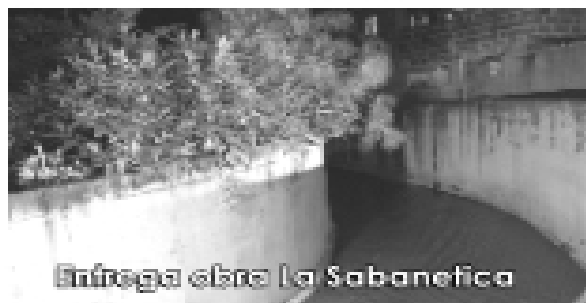
Entrega obra La Sabaneta