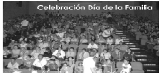
Celebración Día de la Familia