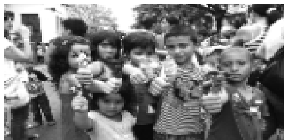
Celebración Día del Niño