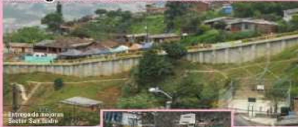
Entorno de la obra en San Isidro

El pasado mes de abril la comunidad de San Isidro en la vereda La Doctora, recibió las obras correspondientes al muro de contención, un parque infantil con cancha de microfútbol y una nueva vivienda, como reposición a la que había sido afectada por el invierno de 2010.