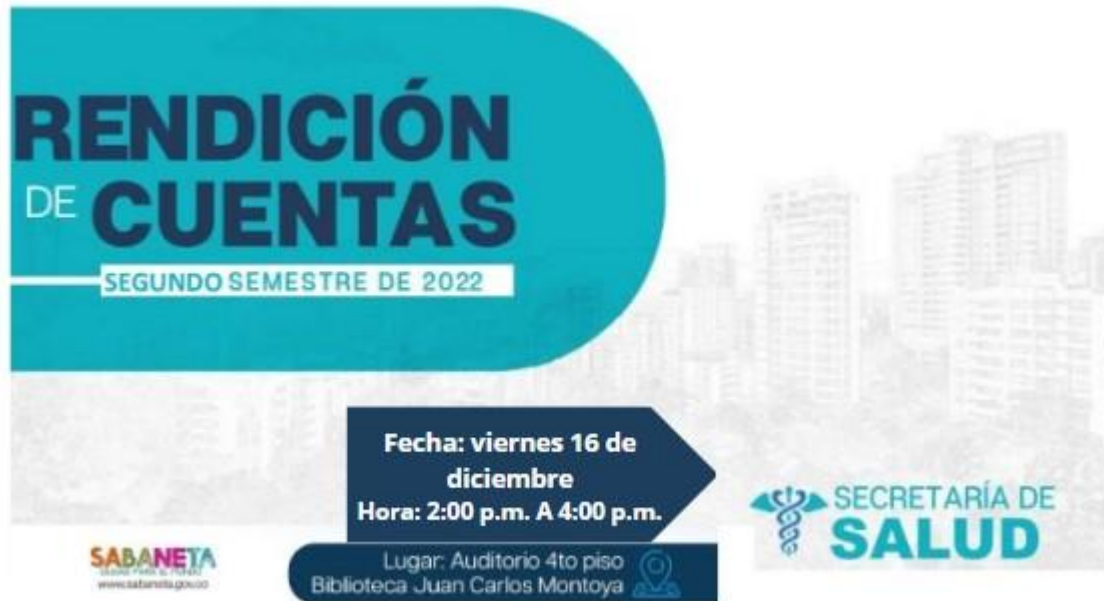
Ilustración Rendición de cuentas