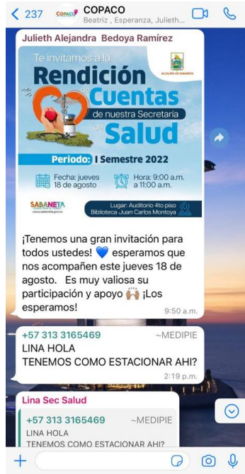
Ilustración Invitación a Rendición de Cuentas WhatsApp